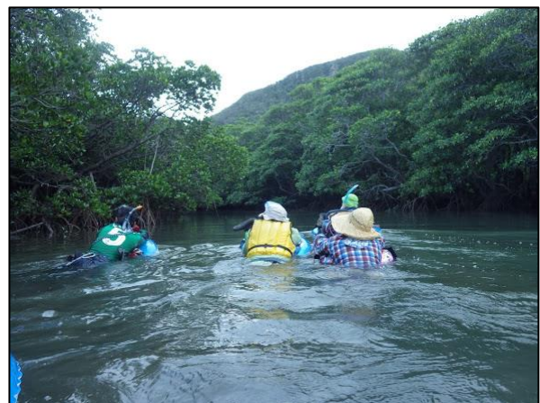
西表島西岸縦走 ジャングル川下り