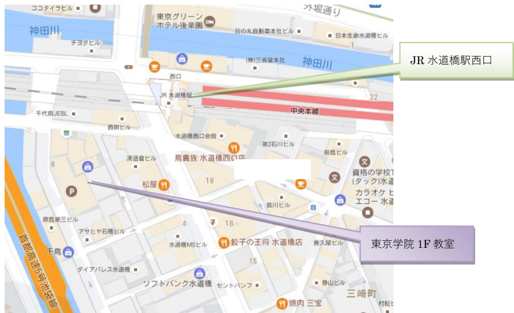
J R水道橋駅西口より徒歩 1 分程度