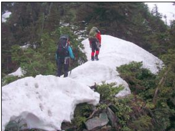
黒部横断 ガンドウ尾根にて