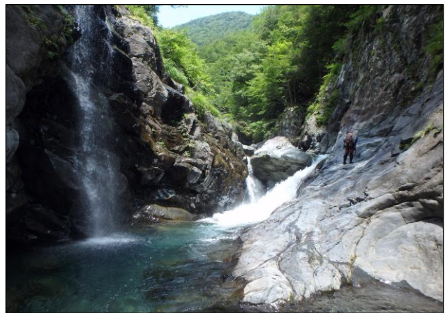
大井川赤石沢にて