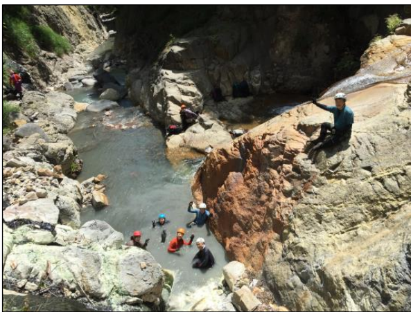
小湯沢にて（温泉・沢登り）

三峰山岳会ホームページ https://www.mitsumine.gr.jp/